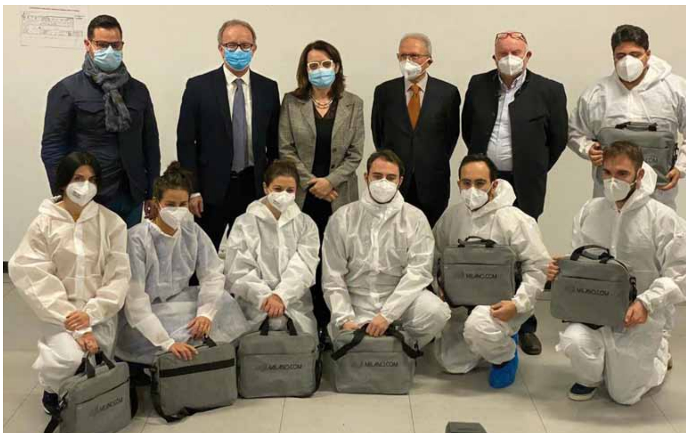
17 Novembre 2020, sede di ATS Pavia: la Fondazione e la Provincia di Pavia donano gli ecografi portatili alle USCA

«Crediamo che in questa fase di difficoltà nazionale, che mette in pericolo sia la salute sia l'economia del Paese, sia doveroso che tutti coloro che ne hanno la possibilità, come individui ma soprattutto come imprese, diano il loro contributo per la risoluzione della crisi. Tra tutte le iniziative meritevoli di aiuto, abbiamo scelto di sostenere quella che sentiamo più affine al nostro spirito aziendale, ossia la ricerca di soluzioni che consentano di affrontare e gestire anche situazioni critiche in rapido mutamento. È quello che facciamo ogni giorno per i sistemi di pagamento e oggi lo vogliamo fare per una causa più grande. Abbiamo proposto l'iniziativa ai nostri dipendenti ed è stata subito accolta con una calorosa adesione. Questo ci fa sentire ancora più uniti come gruppo e partecipi dello sforzo comune per uscire al più presto da questa fase di emergenza».